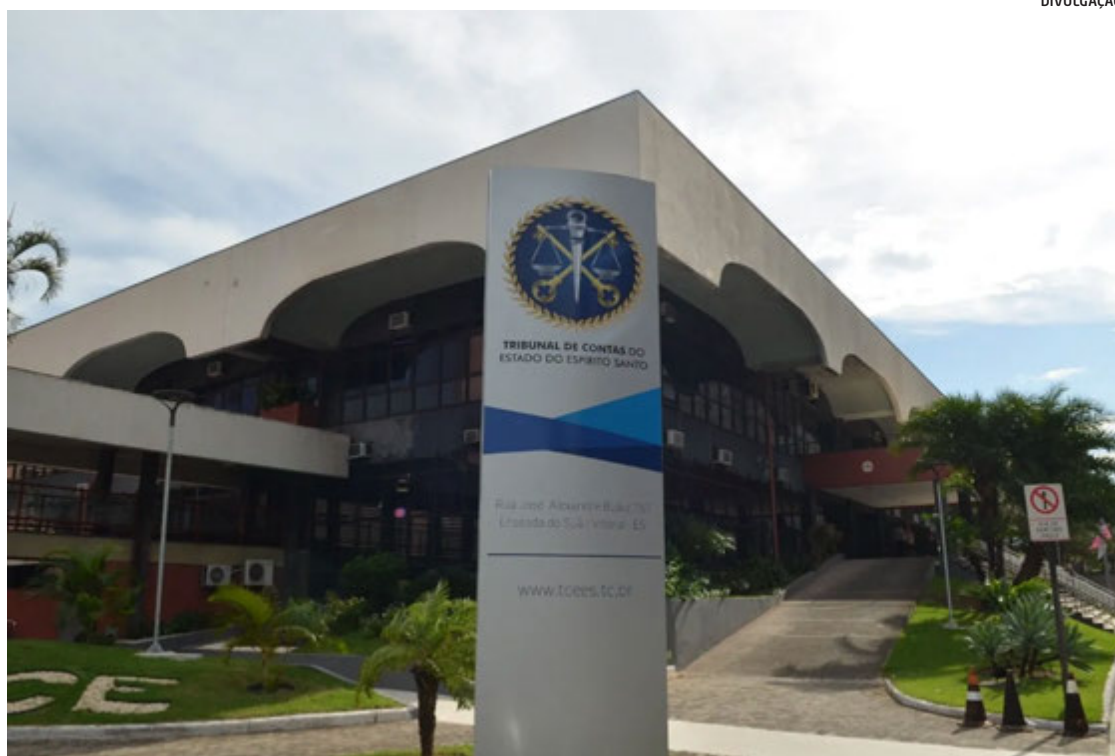
Tribunal de Contas do ES suspendeu pelo menos quatro grandes licitações nos últimos 3 meses

atenção procedimentos de registro de preços utilizados em situações que, segundo o Tribunal, não apresentam a imprevisibilidade exigida pela legislação.