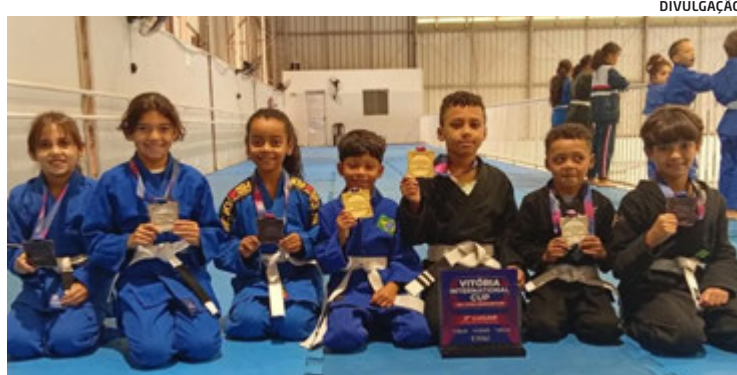
Atletas conquistaram o bronze na Vitória Internacional Cup