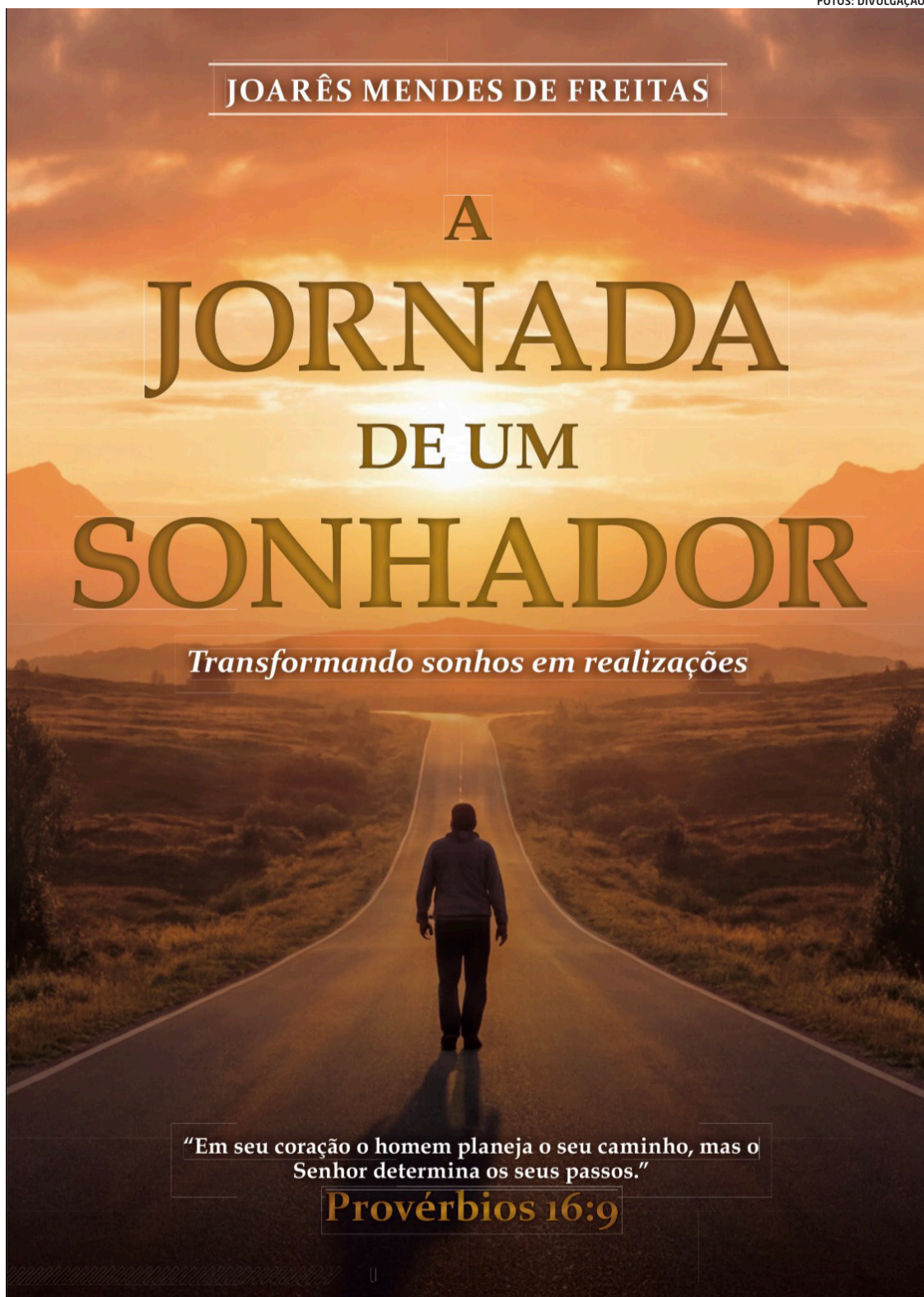
Obra do pastor utiliza narrativa bíblica para discutir temas universais, como perseverança e propósito

Neste domingo, os exemplares já autografados pelo pastor estarão disponíveis para aquisição no auditório principal da PIBJC, logo após os cultos das 10h e das 18h30, no Centro de Celebrações de Vitória, localizado em Jardim Camburi. A obra também pode ser adquirida durante os