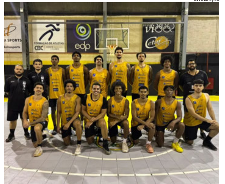
O Instituto Viva Vida/Cetaf (foto) e o Saldanha da Gama irão representar o ES na Copa Litoral, etapa seletiva para a Super Copa Brasil Sub-22

Além da disputa pelo título, a competição também oferece importantes incentivos. O vencedor tem a possibilidade de concorrer a uma posição na Liga de Desenvolvimento de Basquete (LDB) de 2027, enquanto os três primeiros colocados serão selecionados para o programa Bolsa Atleta Federal.