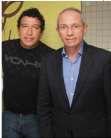
Hartung seria o entrave na aliança entre o PL, de Magno Malta, e o Republicanos

O senador Magno Malta, presidente do PL no Espírito Santo, está jogando com o tempo na decisão sobre se unir ao Republicanos nas eleições de 2026. Ponto de entrave nessa aliança, o ex-governador Paulo Hartung (PSD) pode não concorrer ao Senado, como estaria inclinado, segundo o projeto. Como a coluna já informou, a tarefa nº 1 de PH é construir um projeto para derrotar o governador Ricardo Ferraço (MDB).