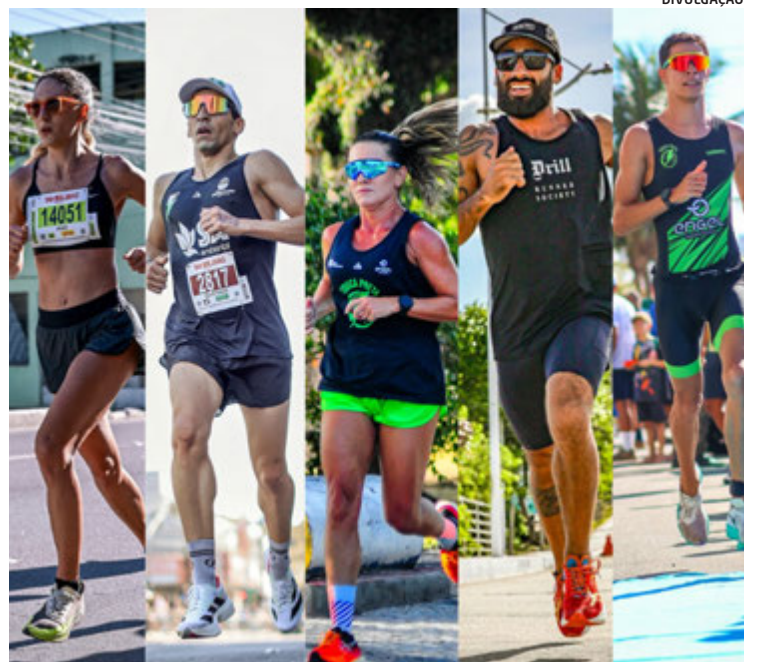
Capixabas têm se destacado nas diversas categorias pelo Brasil