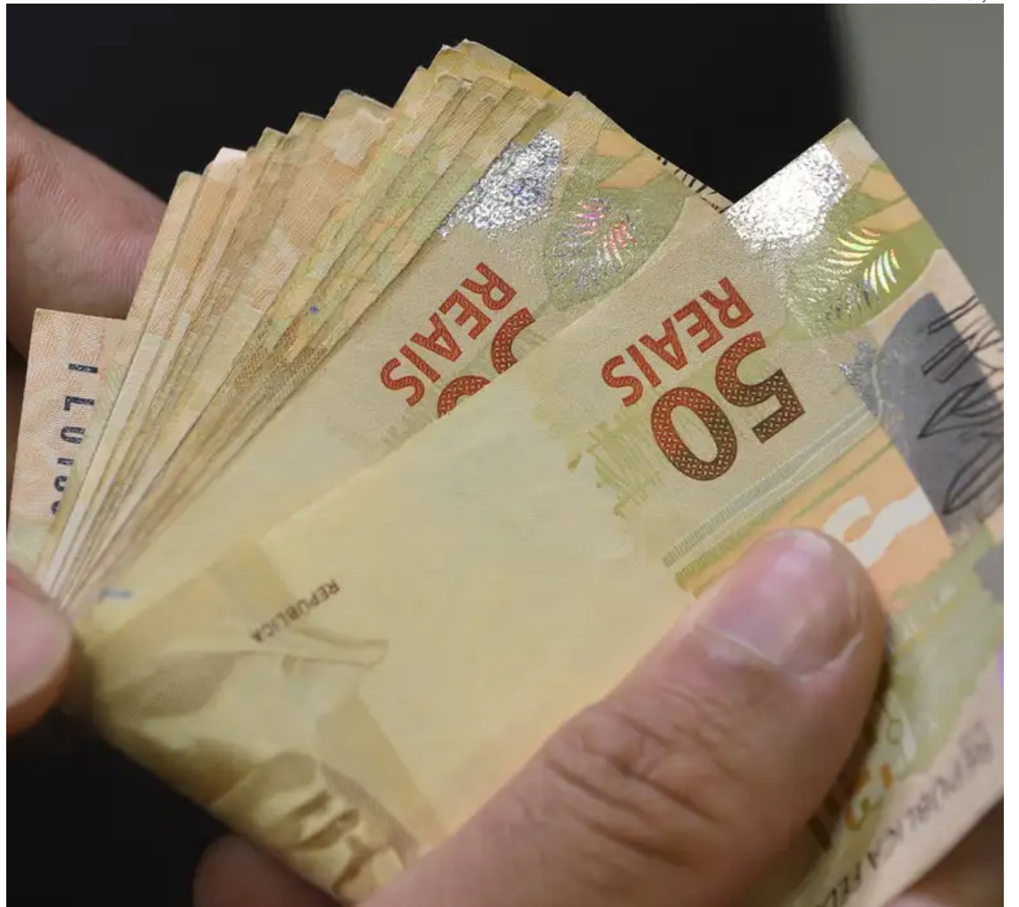
Indicadores como valor dos aluguéis e custo da cesta básica ajudam a medir a qualidade de vida

"Alguns produtos aumentam de preço e simplesmente não voltam ao patamar anterior. Isso altera o padrão de consumo das famílias e afeta principalmente quem ganha entre um e cinco salários mínimos", destaca o Dieese.