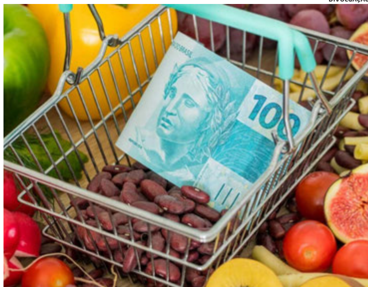
Alimentação é o principal custo da maioria das famílias brasileiras