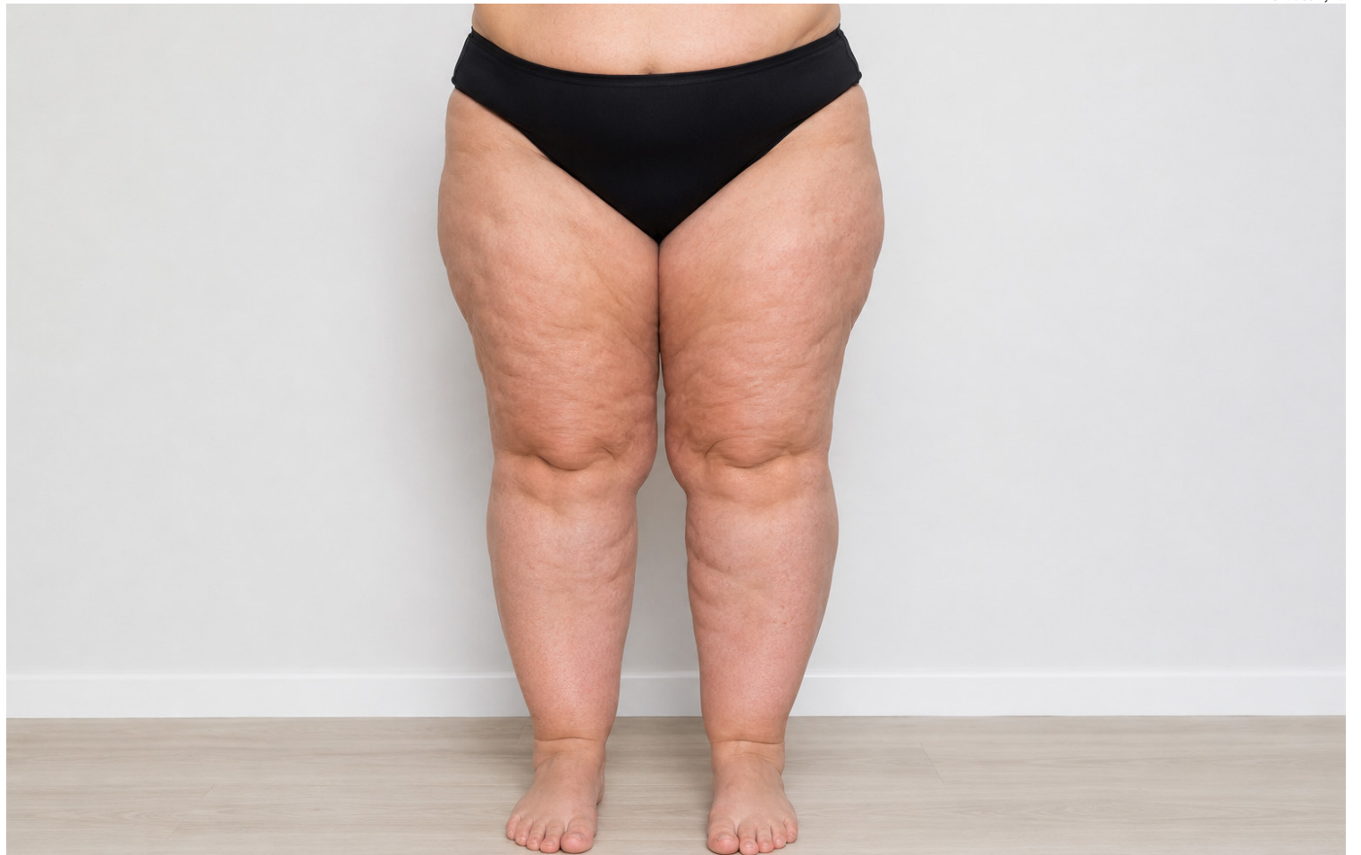
Pernas inchadas, com hematomas sem explicação, sensação de peso e dificuldade para perder medidas na parte debaixo do umbigo alertam

Essa diferença ajuda a distinguir o lipedema da obesidade. Enquanto o ganho de peso da obesidade costuma ocorrer de forma mais uniforme, o lipedema se concentra em áreas