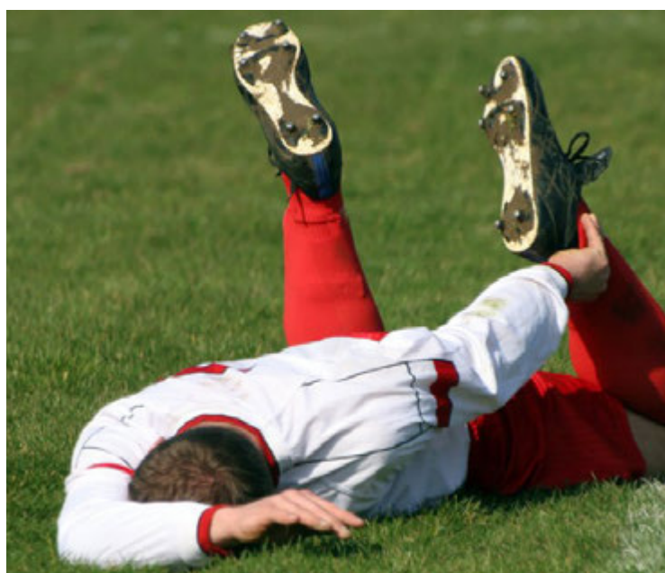
É no segundo tempo que as lesões mais acontecem, aponta estudo

A biomecânica de cada posição também dita o tipo de dor. Jogadores de explosão e velocidade, como atacantes e pontas, sofrem mais com a muscu-