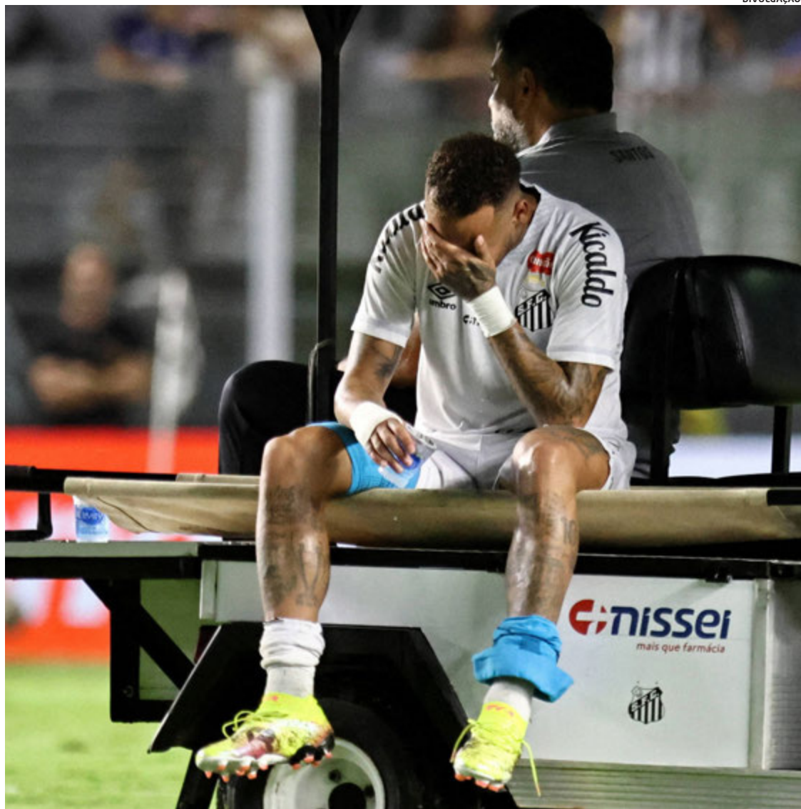
O jogador Neymar sofreu a sua última lesão na panturrilha direita, em maio do ano passado