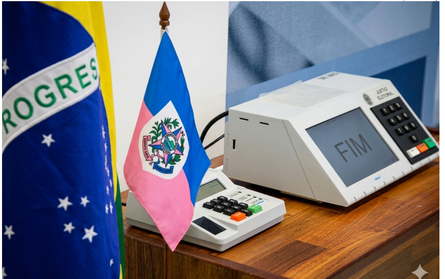
Na eleições de 2026 os eleitores votarão para governador, duas vagas de senador, deputados estaduais e federal e para presidente

Em um ambiente pré-eleitoral ainda distante do pleito, cientistas políticos avaliam que esse contingente não pode ser tratado como estatisticamente residual. Ao contrário: pode funcionar co-