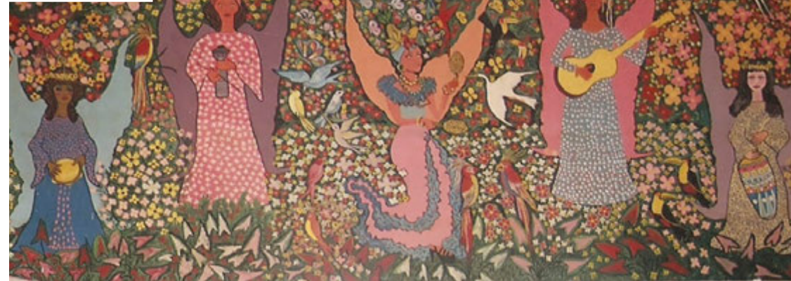
Painel “Seresta no céu”, de Nice Avanza, realizado em 1974 na Igreja de Nossa Senhora da Conceição