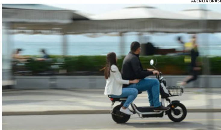
Acidentes envolvendo bicicletas elétricas já fazem parte da rotina

Em debate realizado na Câmara dos Deputados, especialistas defenderam regras mais claras para circulação de veículos elétricos leves, diante da dificuldade de fiscalização e do aumento das ocorrências.