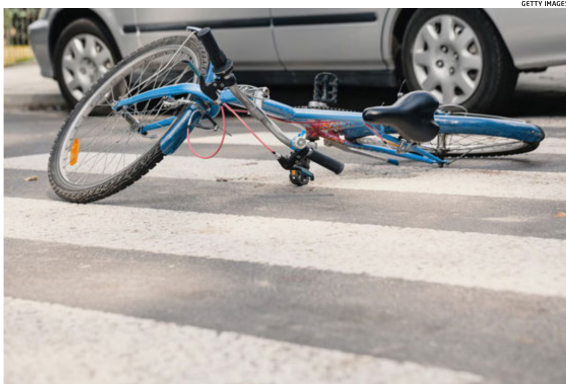
O aumento dos acidentes com bicicletas foi superior a qualquer outro meio de transporte no ES

Os dados da Sesa mostram que homens representam 77% das internações por acidentes de trânsito no Estado. A maior parte das vítimas está na faixa entre 20 e