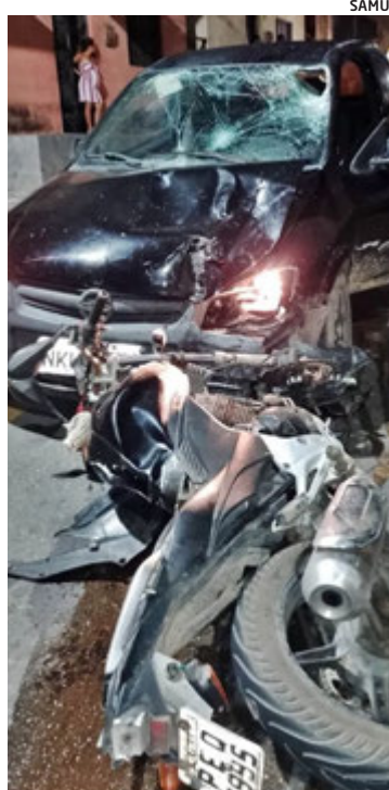
Colisões entre carro e moto são o tipo de acidente de trânsito mais comum no ES

Enquanto isso, os números seguem em alta. Somente as quedas de bicicleta geraram 1.329 atendimentos do Samu 192 entre janeiro de 2025 e março de 2026 no Espírito Santo.