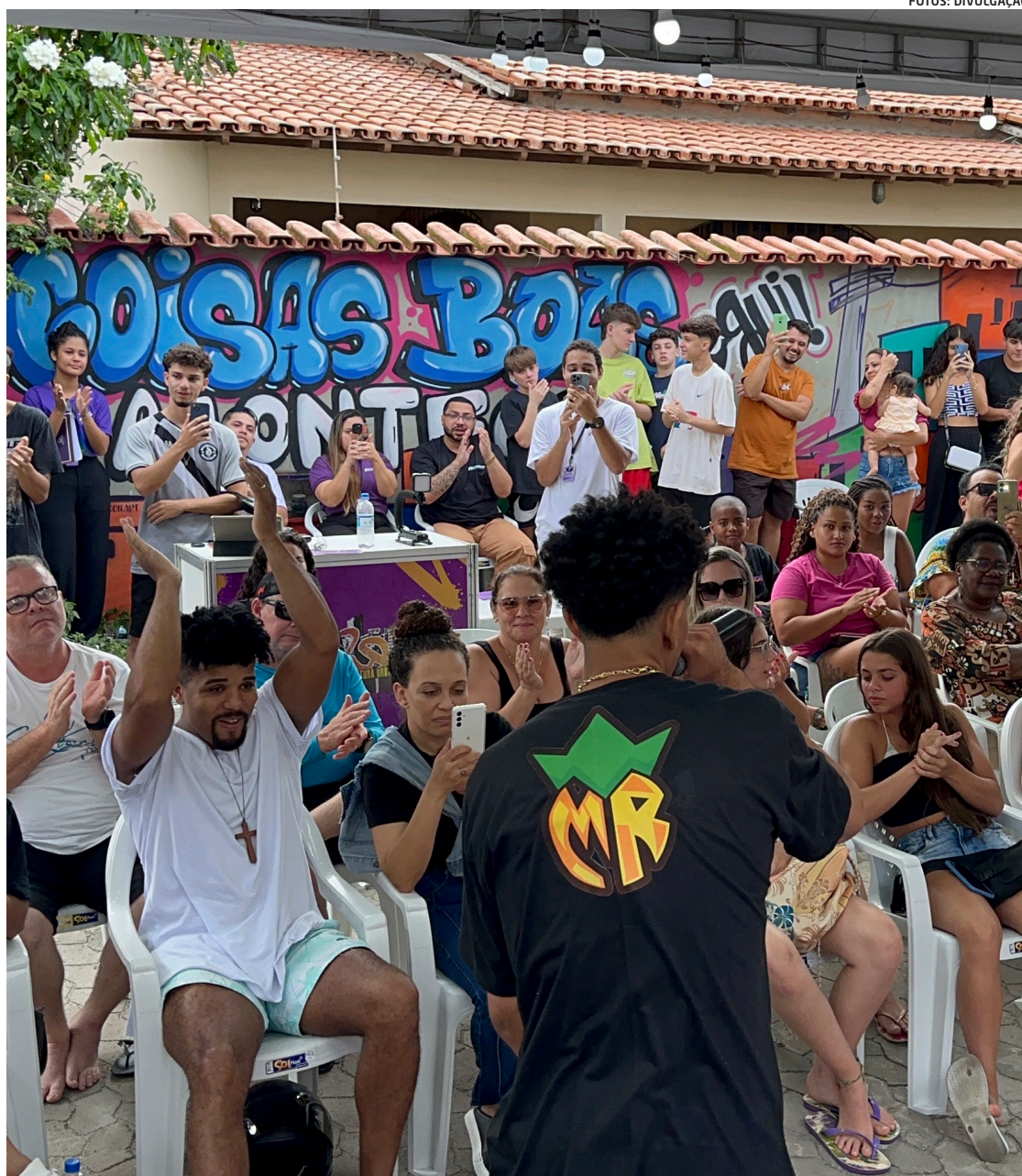
Situada em Marataízes, a Casa Roxa Cultural aposta na articulação a partir da escuta ativa da comunidade

São estruturadas a partir de um modelo que integra poder público, iniciativa privada e sociedade civil. A Casa Roxa acredita nesse tripé como estratégia fundamental para viabilizar e fortalecer suas ações. No setor público, a produtora atua em espaços de representatividade e decisão, como conselhos, fóruns e comissões, contribuindo diretamente na construção e qualificação das políticas culturais. No setor privado, desenvolve parcerias que valorizam e promovem marcas locais a partir da responsabilidade social corporativa, entendida como o compromisso das empresas com impactos sociais positivos nos territórios onde atuam. A Casa Roxa conecta essas marcas a projetos culturais