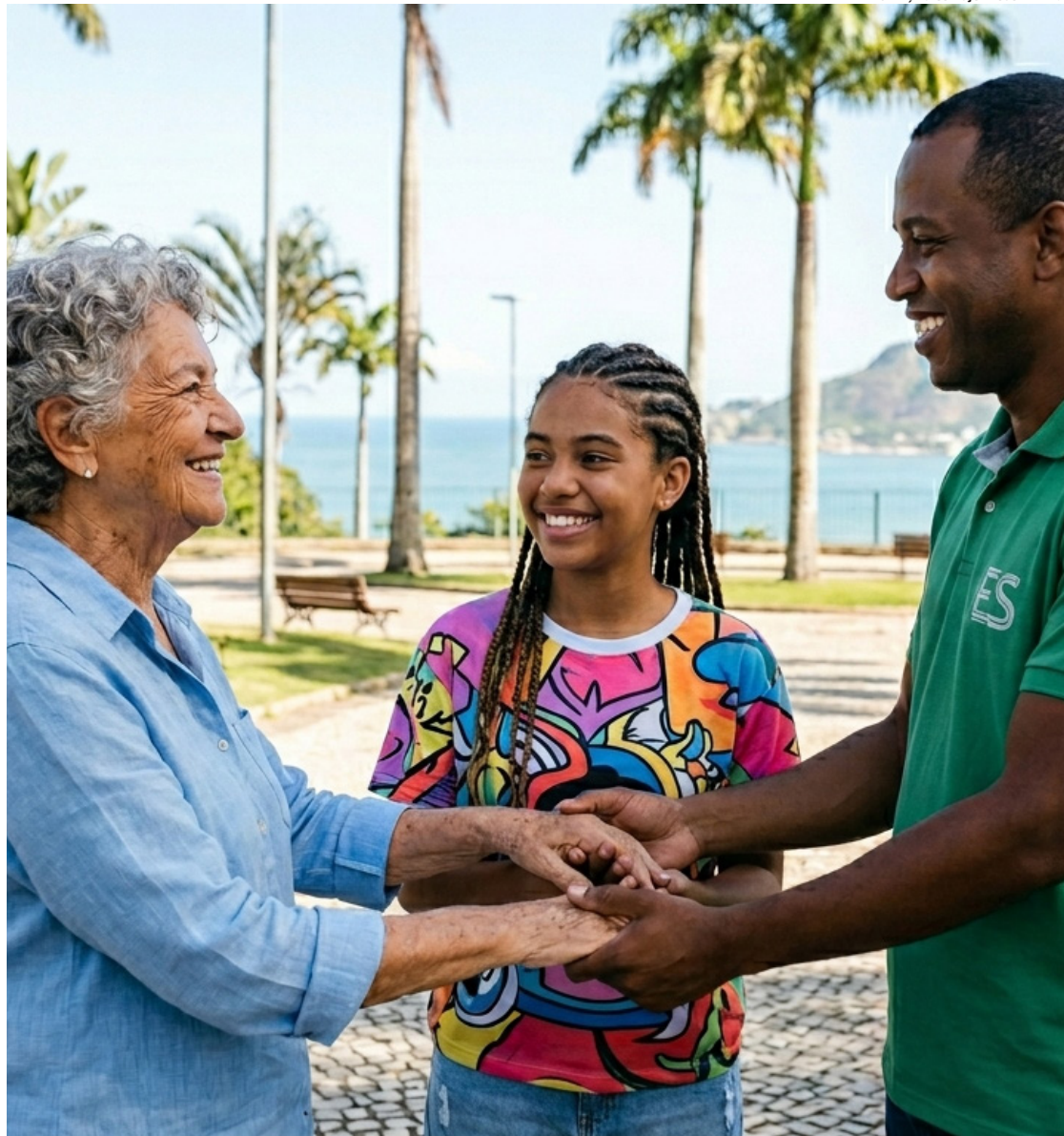
Instituições como de acolhimento às crianças e idosos podem ser beneficiadas com o Imposto de Renda