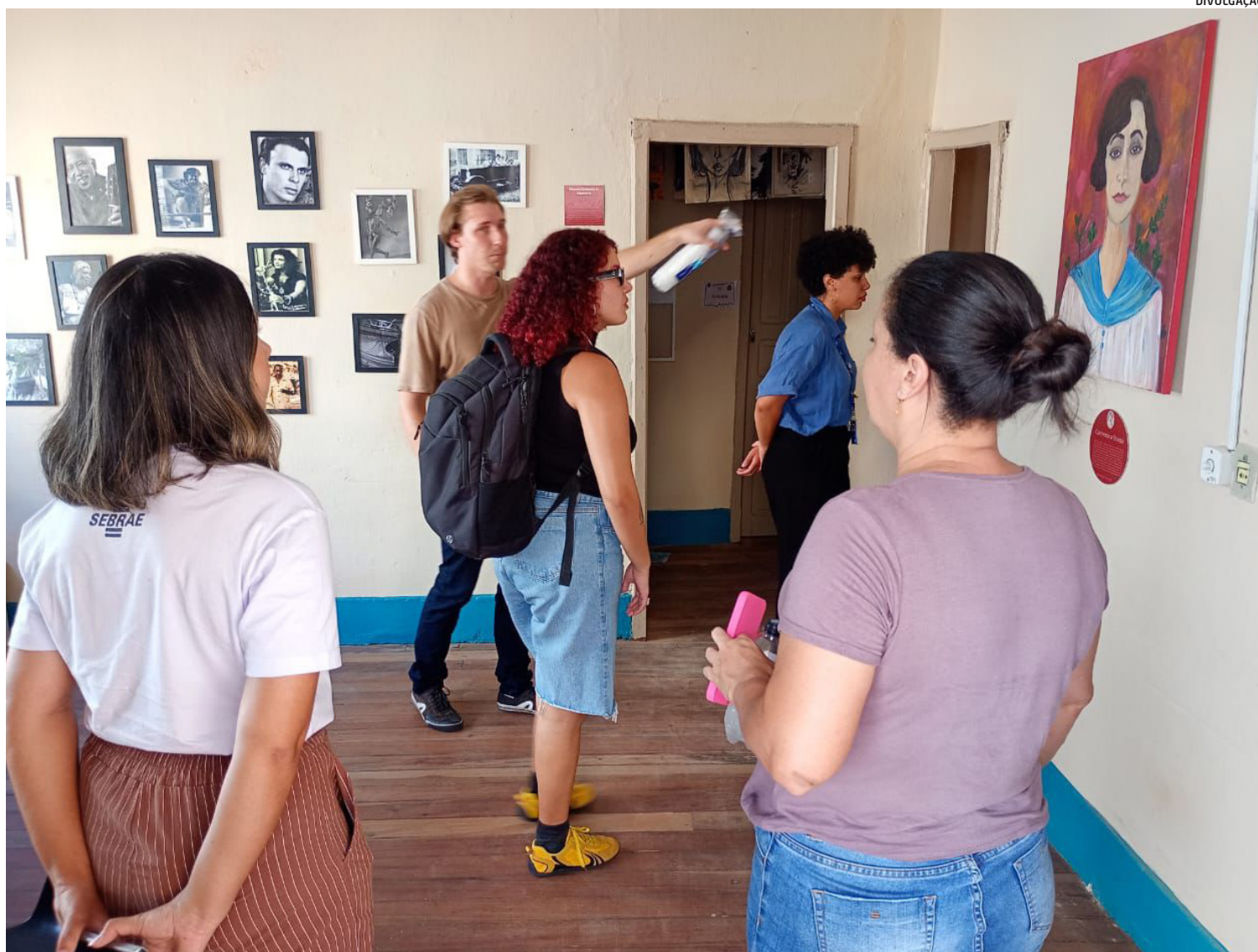
A proposta é combinar múltiplas linguagens e funções em um só lugar, ampliando o acesso e a participação do público em Cachoeiro

mô é um espaço criado para valorizar a arte e o artista cachoeirense e capixaba, por isso esse diálogo é feito através de espaço para criação e realização de atividades culturais, como apresentações, exposições, tudo que o artista puder divulgar o seu trabalho dialogando com o público. Além disso, toda a casa tem uma extensa decoração que conta a história cultural cachoeirense, o que ajuda a manter esse diálogo latente.