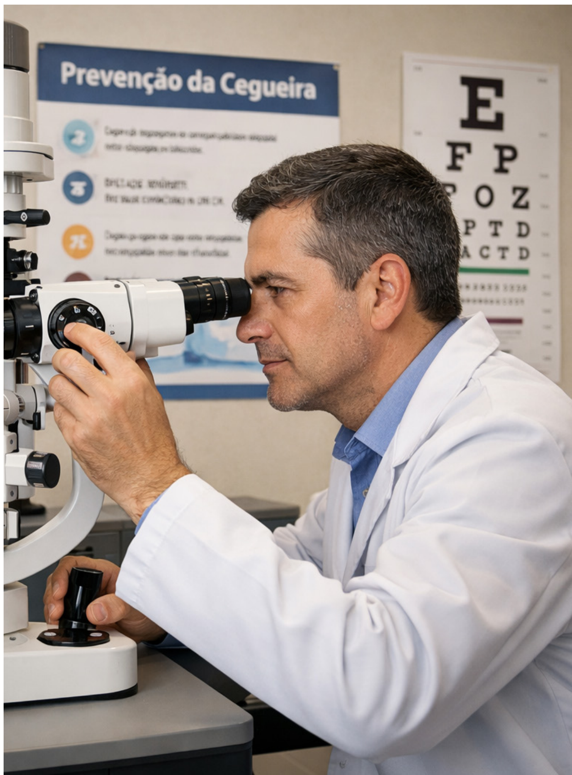
Há tratamento gratuito no Espírito Santo por meio do Sistema Único de Saúde (SUS)