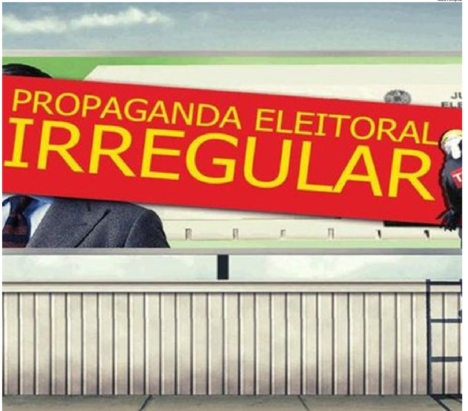
O eleitor que ouvir e registrar um pedido de voto, neste momento, deve denunciar o comportamento à Justiça Eleitoral

O conceito central que a Justiça utiliza para punir um político hoje não é mais a "intenção", mas sim o "pedido explícito de voto". Enquanto o parlamentar ou cidadão se limita a debater projetos, criticar gestões ou expor suas qualidades pessoais, ele está dentro do exercício da liberdade de expressão. O problema surge quando a fronteira