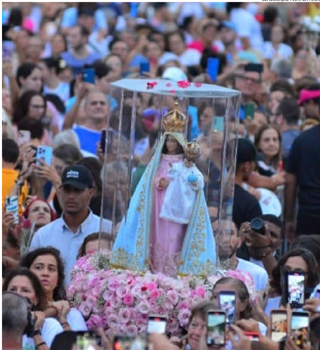
Grandes multidões participam das romarias ao longo de toda programação da Festa da Penha

A tradicional comemoração do dia da padroeira começou ainda em 1570, realizada pelo Frei Pedro Palácios. A festa passou a crescer e atrair fiéis de todo o país, se tornando a terceira maior festa religiosa do Brasil.