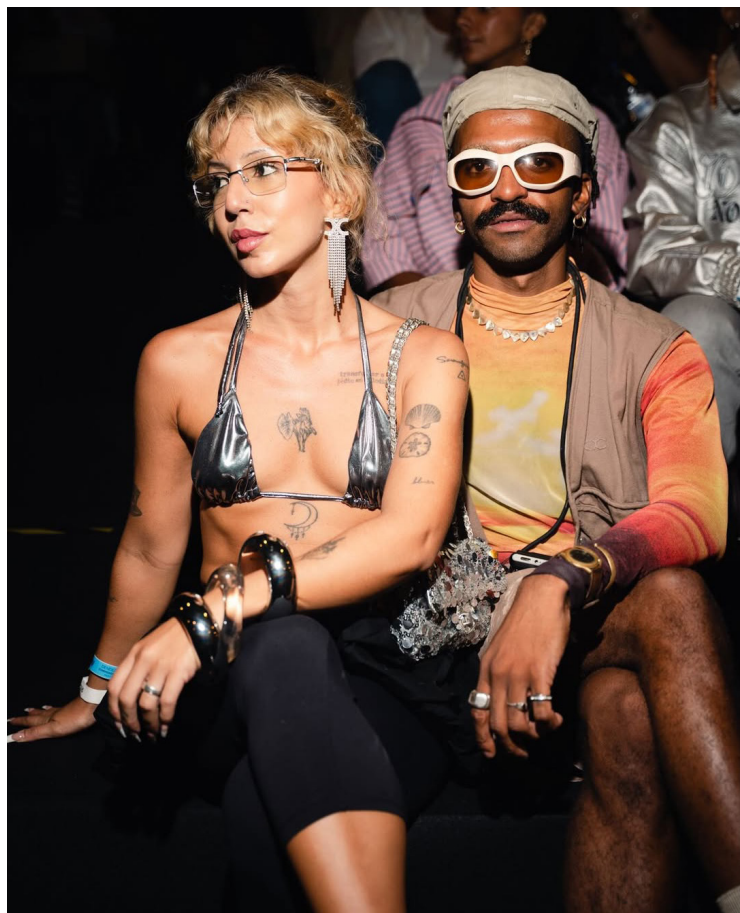
Estilista trabalha conectando corpo e experiências de vida

Não vejo essas áreas como campos separados, mas como linguagens que transitam numa composição. A moda é o ponto de partida, mas o design organiza e estrutura a ideia, enquanto a direção de imagem constrói a narrativa final. Meu processo é pensar tudo de forma integrada: cada elemento — roupa, cenário, corpo, luz — atua como parte de um sistema visual. O objetivo é criar imagens que não sejam apenas estéticas, mas que carreguem conceito, intenção e discurso.