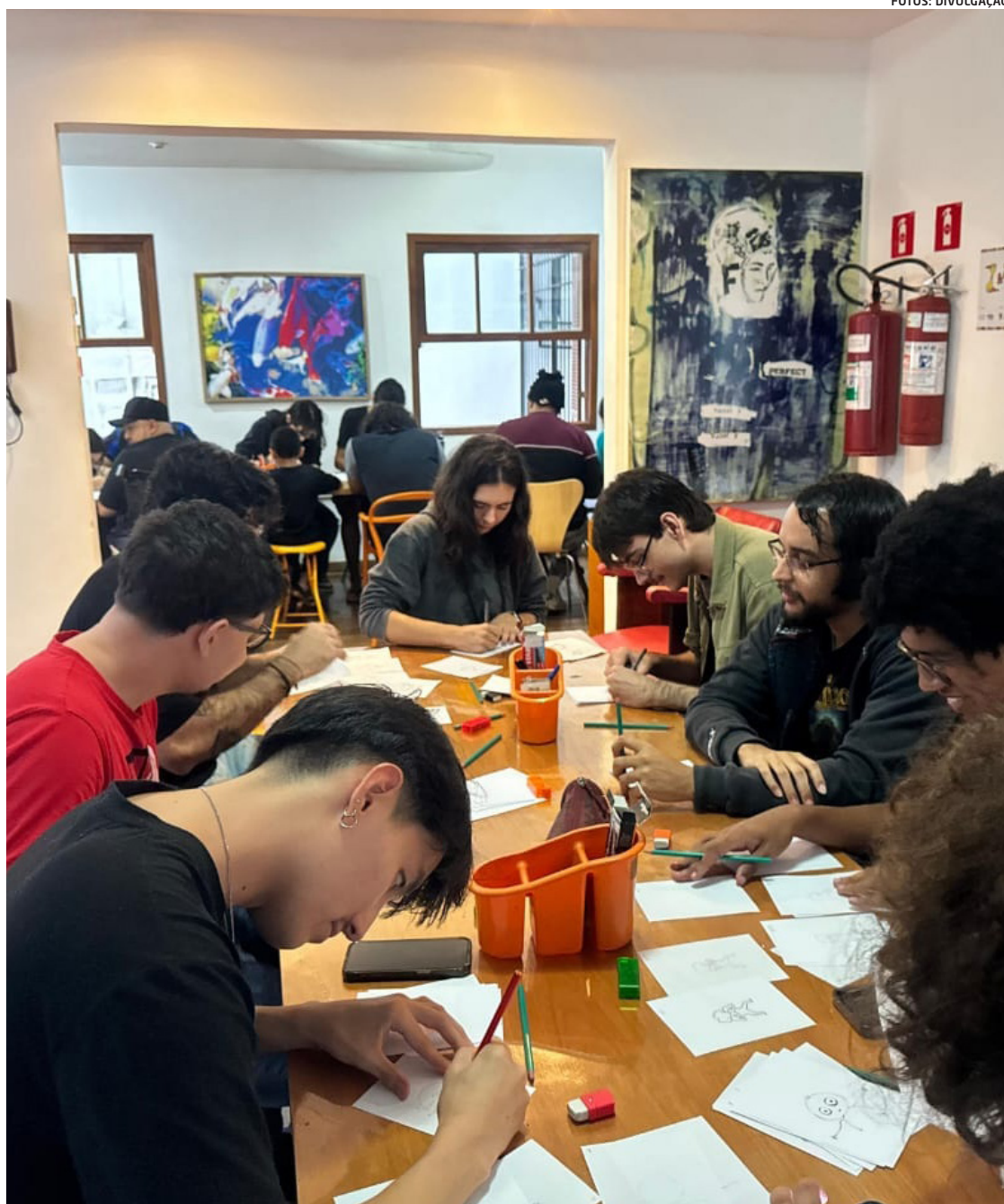
O Instituto Marlin Azul tem 27 anos de trajetória visando democratizar a cultura audiovisual no ES

Os tempos digitais criaram formas de acesso e distribuição dos conteúdos audiovisuais criados pelo Instituto Marlin Azul. De qualquer lugar, o usuário da rede assiste às animações, ficções e documentários produzidos pelos diferentes projetos, acompanha as mostras audiovisuais temáticas, as exposições de arte, oficinas, podcasts e as cartilhas educativas. O IMA Cul-