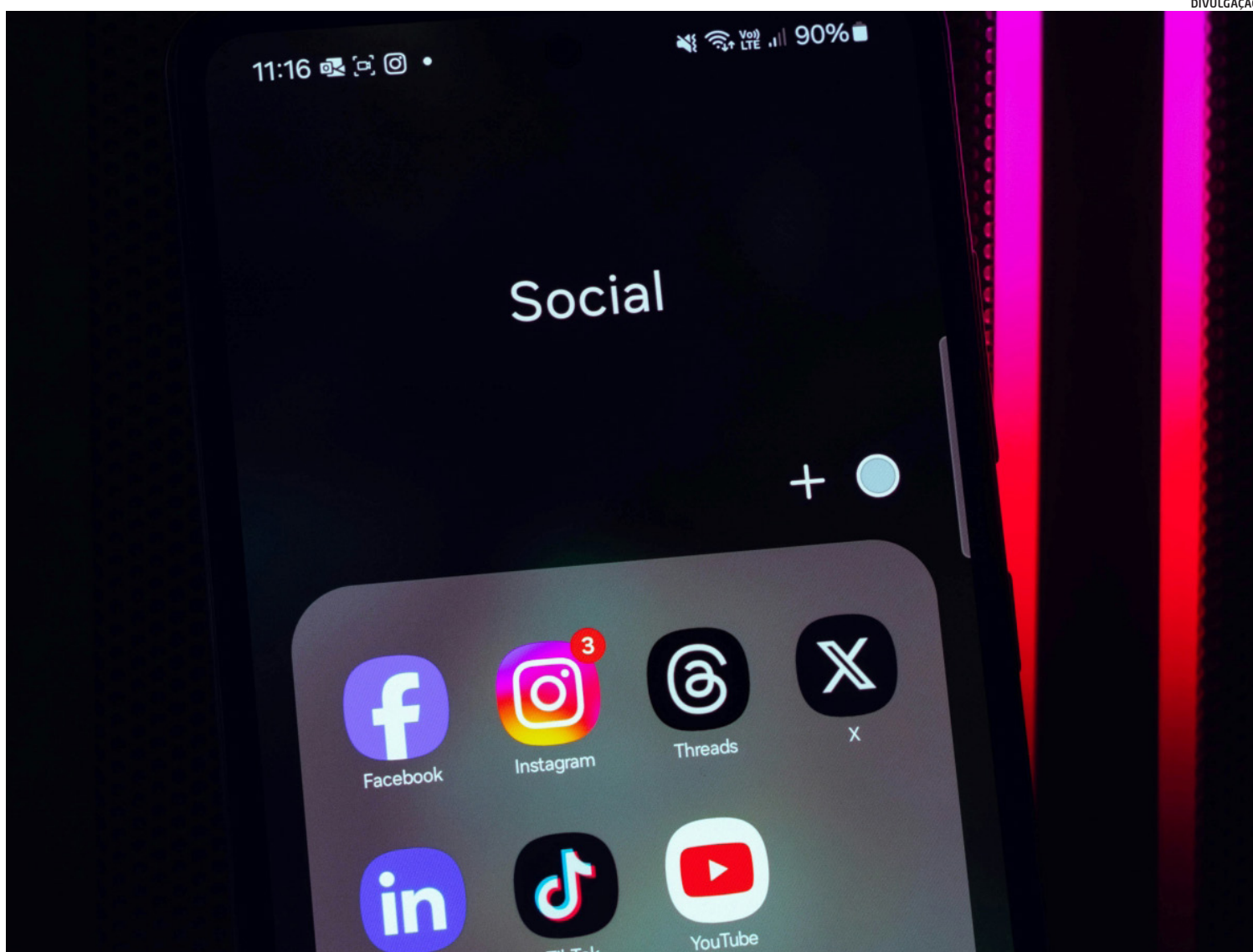
O relatório do estudo do Meta aponta que, desde 2019, são muitos os efeitos problemáticos pelo excesso do uso das redes sociais

Por isso, as empresas citadas foram intimadas a entregar documentos e comunicações internas referentes a um período de mais de dez anos. Esse material levou os jurados a concluir que as companhias estavam cientes dos riscos e foram negligentes.