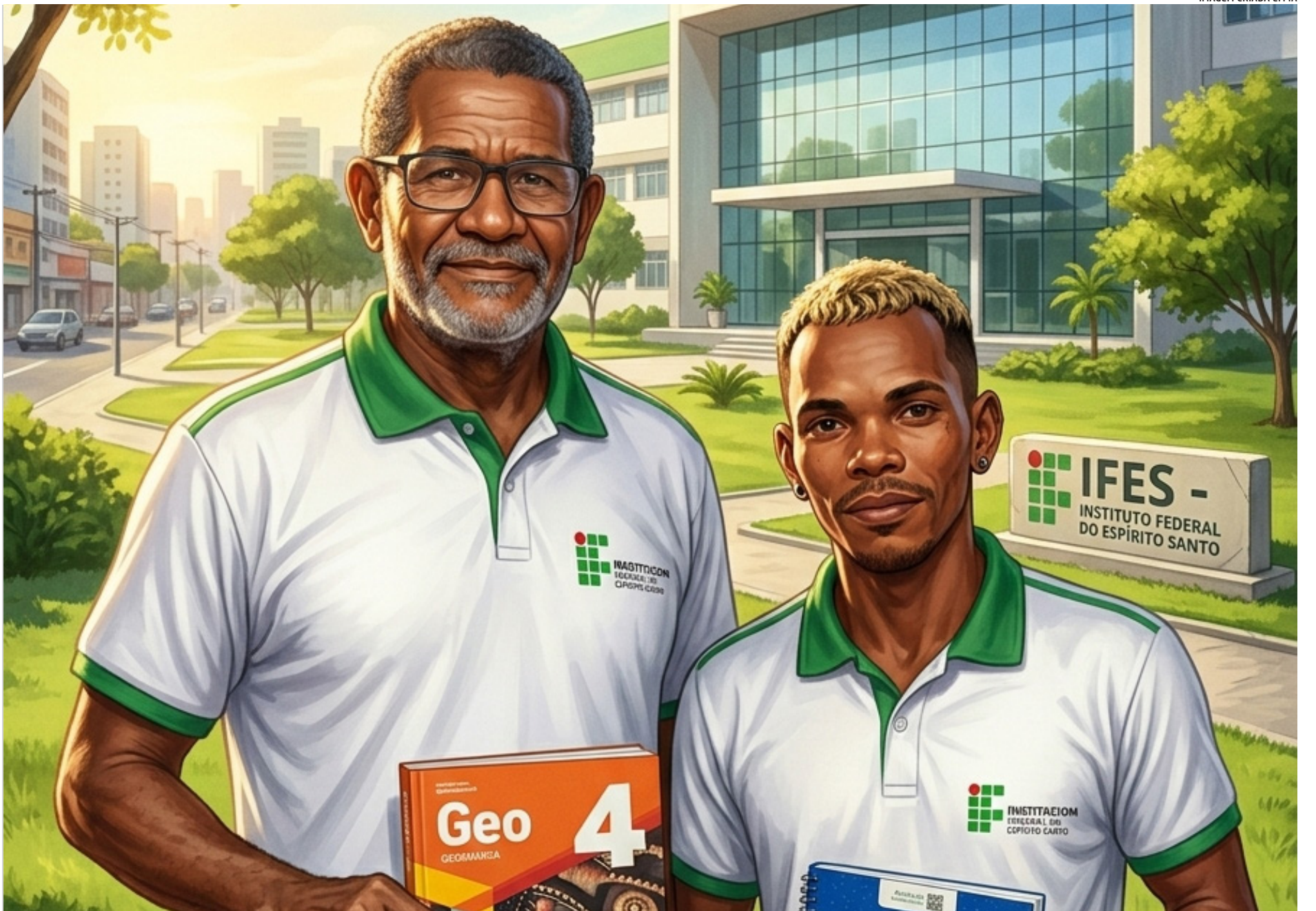
IMAGEM CRIADA EM IA

Dois internos de abrigos da prefeitura de Vitória foram aprovados para cursos técnicos no Ifes; ao todo são 16 histórias de oportunidades agarradas ))3