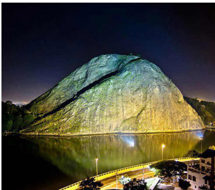
A pedra do Penedo é conhecida como a sentinela de Vitória

Frei Pedro Palácios trouxe da Europa uma valiosa pintura da Virgem com o Menino Jesus e a colocou numa pequena capela ao pé do Monte das Palmeiras. Porém, o quadro desaparecia misteriosamente e era sempre encontrado no alto do monte, entre duas palmeiras. A cada vez que o painel retornava ao topo, a comunidade entendia que a Virgem queria morar ali. Após repetidos episódios, os moradores, guiados por Frei Pedro Palácios, construíram uma pequena ermida no cume em 1566, onde o painel foi finalmente instalado. Assim nasceu a Ermida das Palmeiras, que mais tarde deu origem ao Convento da Penha, tornando-se um dos principais santuários do Espírito Santo, em Vila Velha.