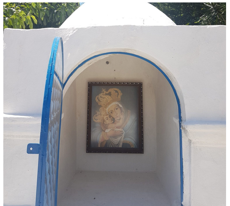
Quadro desaparecia e era sempre encontrado no alto do monte