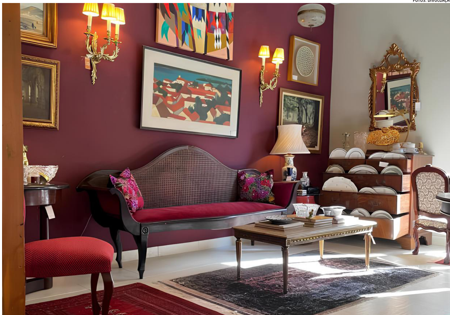
No térreo uma seleção que inclui mobiliário de época, esculturas e objetos decorativos, acima galeria e espaço para as exposições

No piso superior, a galeria concentra obras de artes visuais e um espaço versátil destinado a exposições temporárias, mostras itinerantes e projetos colaborativos. A proposta é que o ambiente receba iniciativas em articulação com artistas, colecionadores, arquitetos, designers e pesquisadores, ampliando o intercâmbio