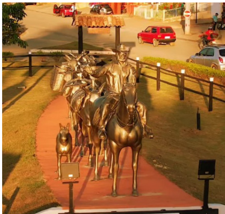
Monumento dos tropeiros é reverenciado pela história de Ibatiba