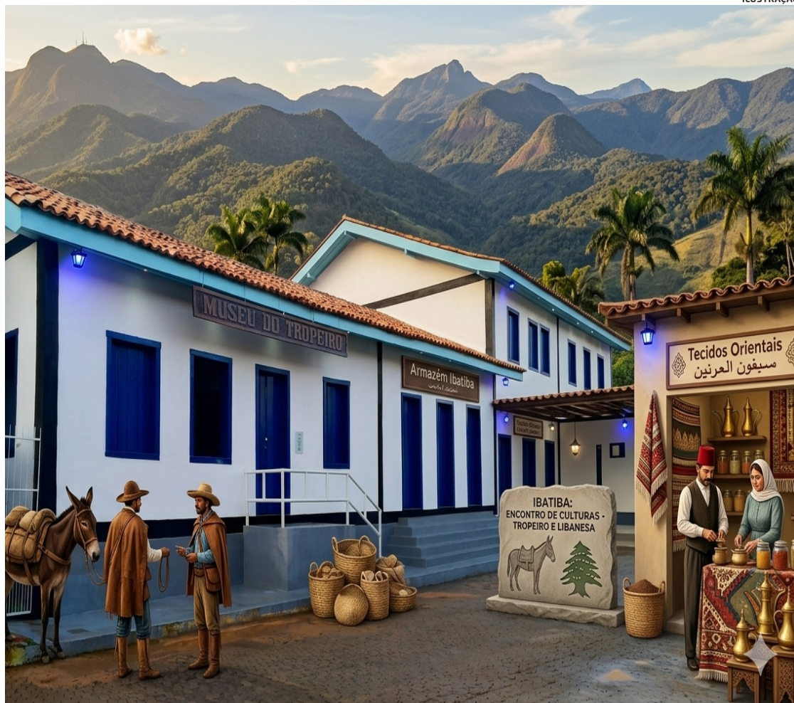
Imigrantes libaneses passaram de itinerantes para os primeiros a fixarem atividade econômica

Esse processo foi decisivo para a consolidação de Ibatiba. Mais do que participar da economia local, esses imigrantes ajudaram a estruturá-la, criando as bases de um comércio que sustentaria o crescimento da cidade nas décadas seguintes.