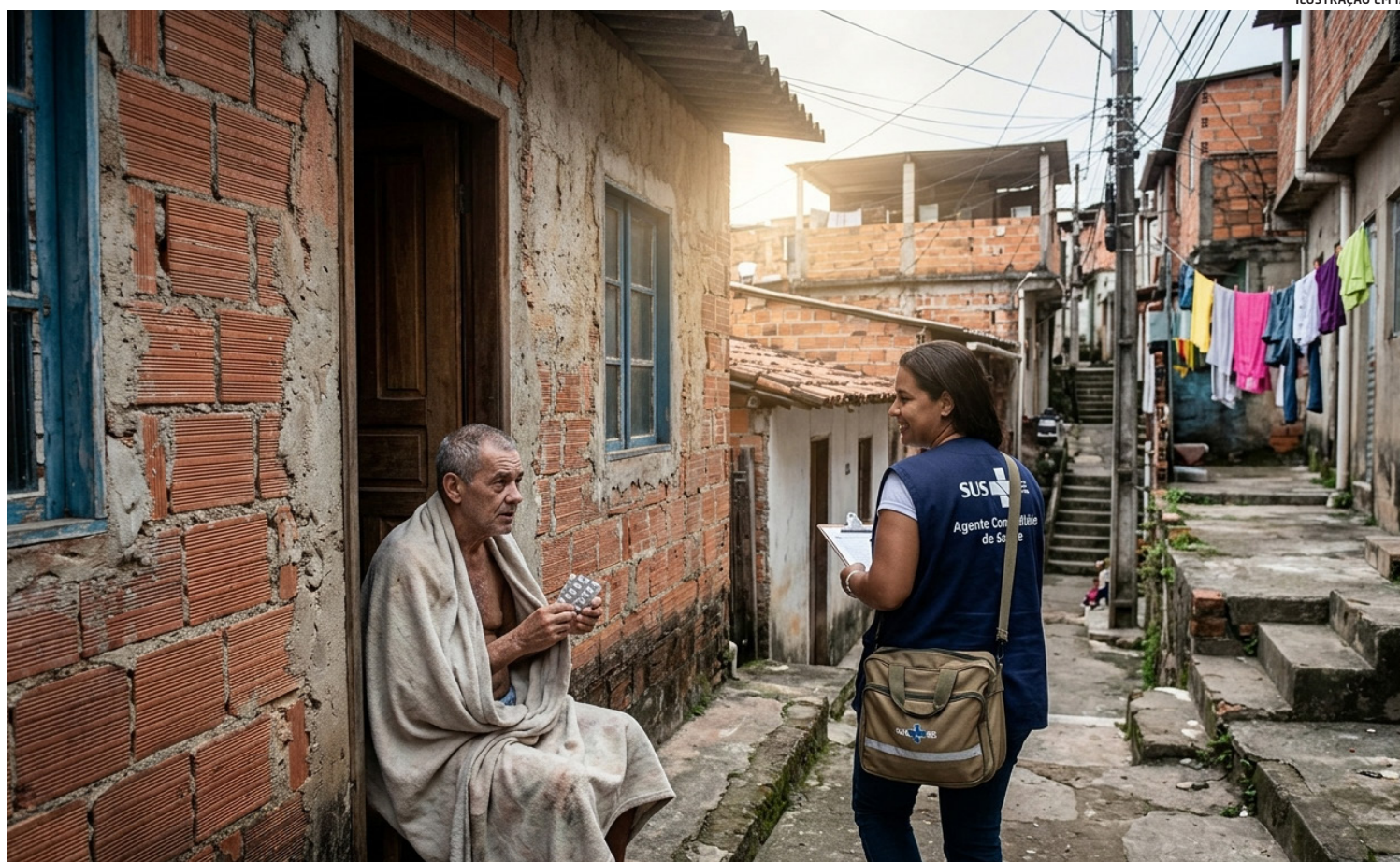
ILUSTRAÇÃO EM IA

Soma-se a isso o impacto das sequelas pulmonares da COVID-19, que podem aumentar a