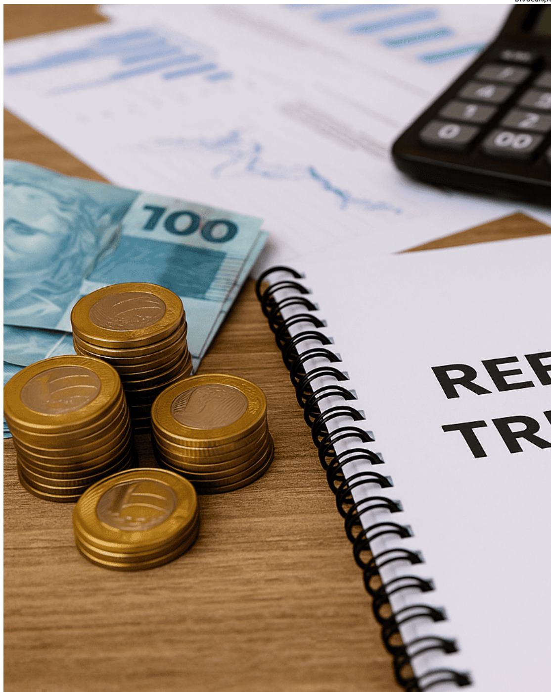
A expectativa é que os novos tributos entrem em vigor de forma gradual entre 2026 e 2033

Seguindo o modelo atual de alguns produtos, a nova legislação prevê que a cobrança seja realizada de forma monofásica, ou seja, concentrada em uma única etapa da cadeia comercial — geralmente na refinaria ou na usina produtora. Essa concentração tende a simplificar a apuração dos tributos e a trazer maior transparência ao consumidor, que poderá entender melhor