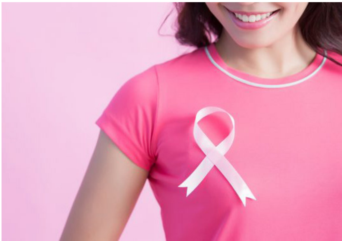
Outubro Rosa: uma das campanhas mais fortes no país, conscientizando sobre o câncer de mama

O mês já começa com a campanha Outubro Rosa. O movimento internacional criado na década de 1990 para conscientizar sobre a prevenção e o diagnóstico precoce do câncer de mama. Além da iluminação de monumentos com a cor rosa, mutirões são organizados para diagnosticar a doença. O Outubro Rosa é marcado, também, para reforçar a importância da prevenção do câncer de mama - a doença que já registrou mais de 500 novos casos no estado do Espírito Santo.