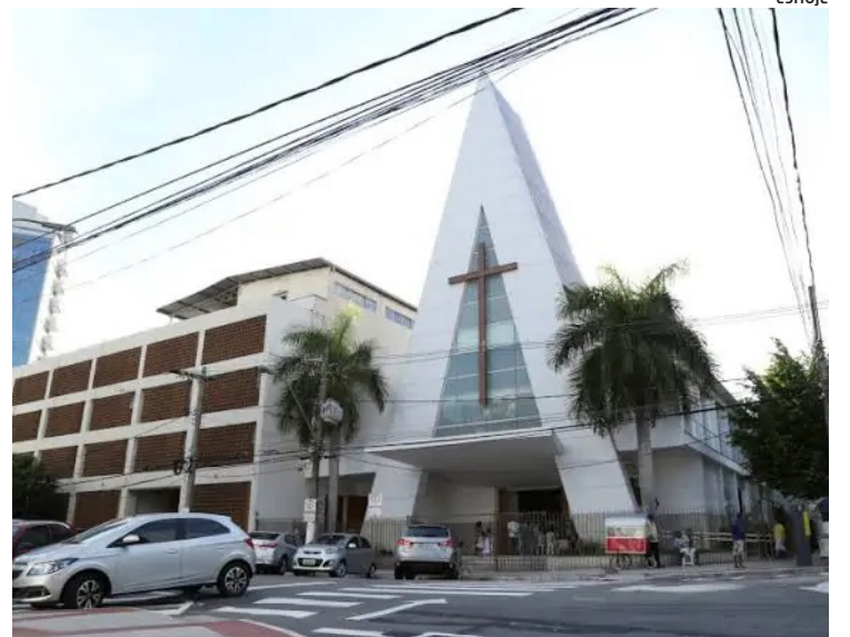
A paróquia Santa Rita de Cássia está localizada na Praia do Canto