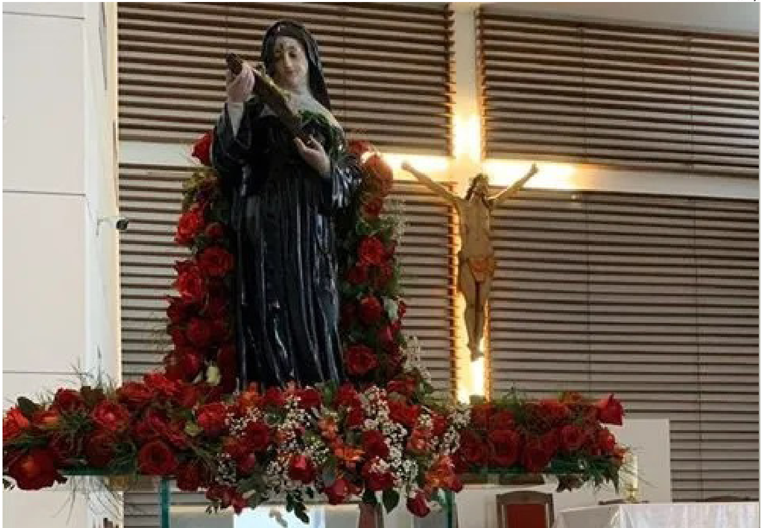
No dia da santa a igreja, na Praia do Canto, promove a bênção das rosas, período em que o local recebe maior número de fiéis