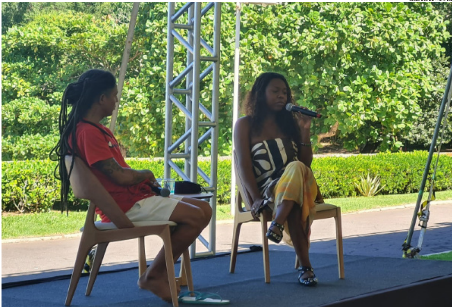
Os dois artistas comentam não só o novo espaço, mas a importância da democratização e valorização da cultura no Espírito Santo

O Ciclo acontecerá nos meses de maio, junho e julho em módulos presenciais e virtuais, e as formações serão ministradas por pessoas reconhecidas em suas