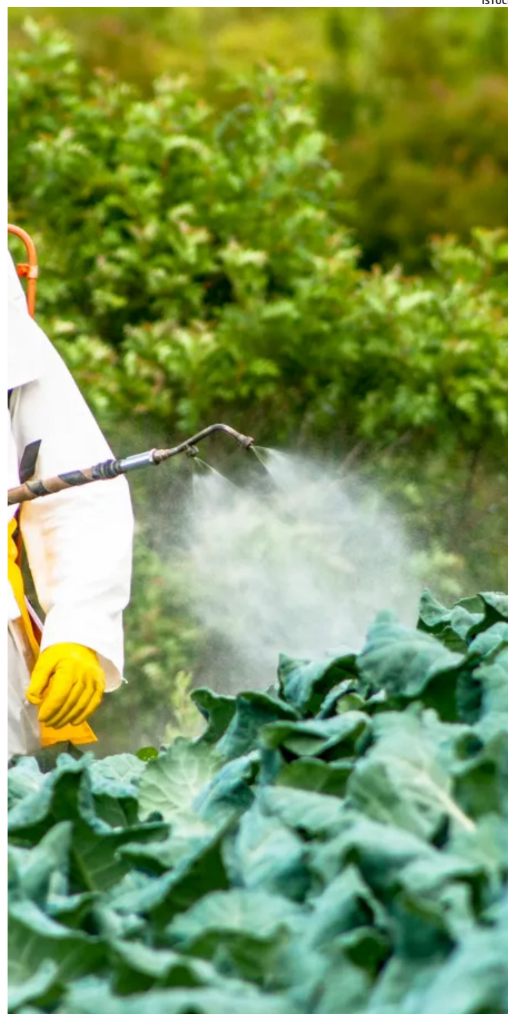
Brasil é o recordista mundial no consumo de agrotóxicos

Corra ressalta ainda que, apesar de o preço ser um pouco mais elevado, os alimentos orgânicos têm maior durabilidade e são, de fato, mais seguros para o consumo.