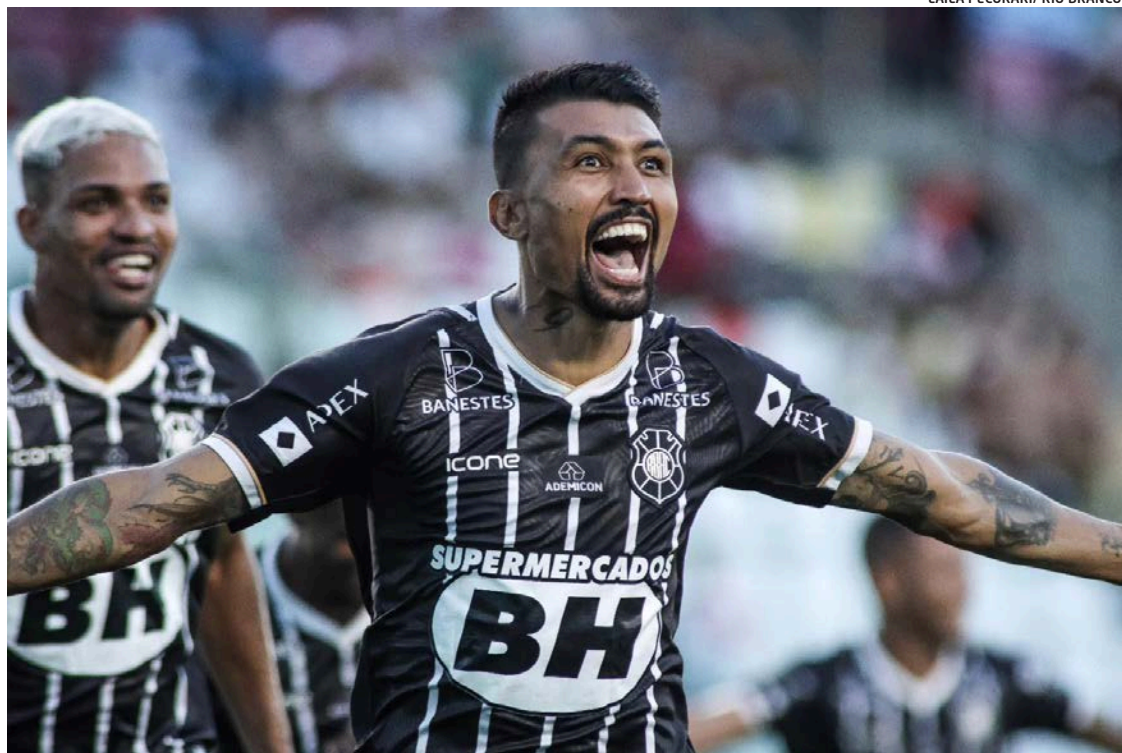
LAILA PECORARI/ RIO BRANCO

Ao ser questionado se acredita que sua equipe será capaz de reverter a vantagem do xará Rio Branco, Canário foi direto. “Com certeza! É uma final e tudo pode acontecer. Trabalhamos durante essa semana, com foco também na parte psicológica, que vai ser muito importante pra esse segundo jogo da final”.