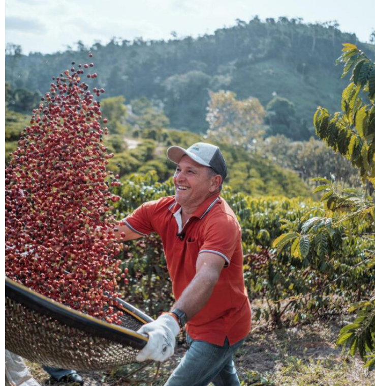
Previsão é que área plantada de conilon cresça no ES em 2024

De fato, o Espírito Santo é referência na produção de café, sendo responsável por três a cada quatro sacas de Conilon produzidas no País. No ano passado, a área plantada do Conilon no Espírito Santo foi de 259.174 hectares, o que rendeu uma média de 47,7 sacas por hectare e, para este ano, a previsão é de 261.921 hectares plantados segundo dados levantados pela Gerência de Dados e Análises da Secretaria da Agricultura, Abastecimento, Aquicultura e Pesca (Seag). Ainda segundo o levantamento, a cafeicultura capixaba gera cerca de 400 mil empregos diretos e indiretos, e está presente em mais de 75 mil das 108 mil propriedades agrícolas do Estado.