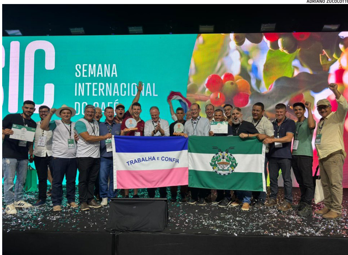
Cafés capixabas venceram as duas categorias do prêmio internacional Coffee of The Year 2023

A valorização dos cafés especiais se tornou parte da cultura cafeeira no Estado a ponto de termos agora uma tradição na conquista de prêmios pelo mundo. Recentemente, pequenos produtores da região das montanhas capixabas foram premiados durante a Semana Internacional do Café (SIC) pela qualidade de seus