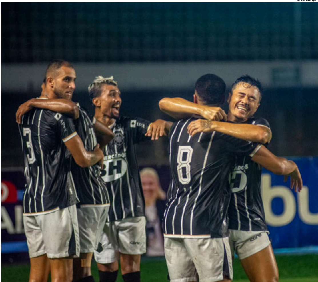
Rio Branco terminou a fase de grupos em primeiro lugar e vai enfrentar o Nova Venécia, fora de casa