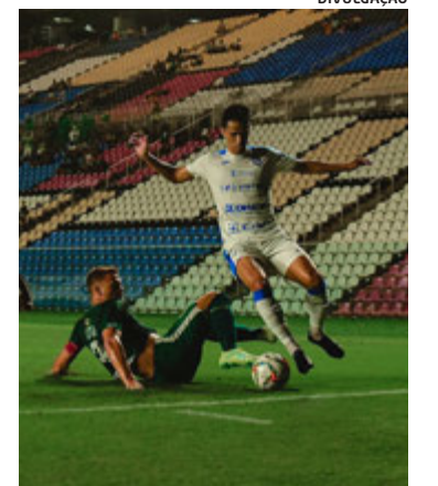
Principais jogadores do Vitória jogarão contra o Real Noroeste