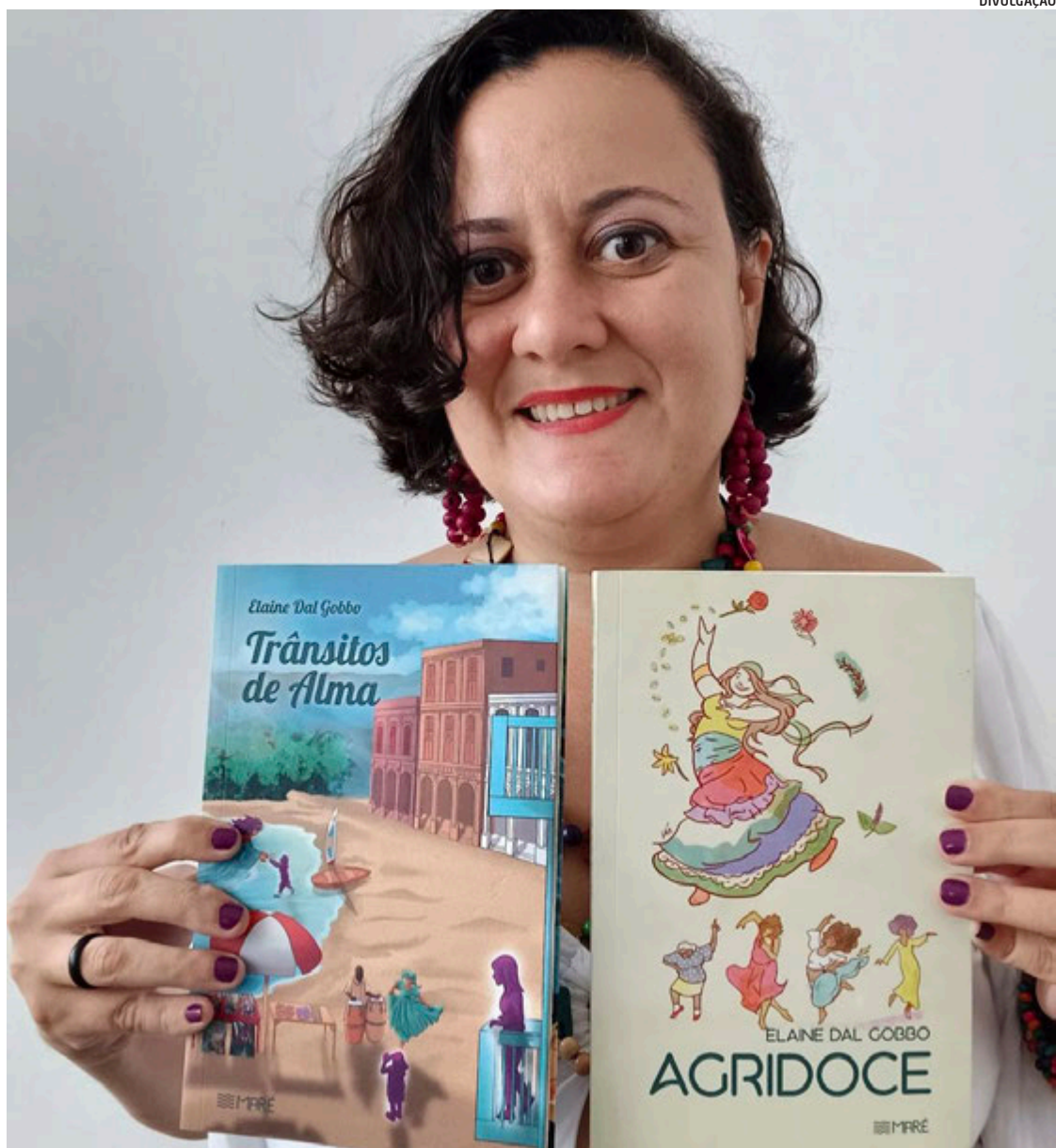
“Agridoce” aborda temas como violência doméstica, mas também o acolhimento entre mulheres