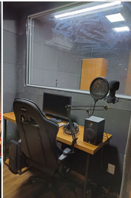
LabPoca de São Torquato é focado no audiovisual e na produção musical; o rap é dos ritmos mais demandados pelos jovens da região

artística no rap, se tornando um importante nome da cena no Estado. Hoje, ele, que é um dos coordenadores do CRJ de São Torquato, pode presenciar os frutos de sua perseverança bem diante dos seus olhos.