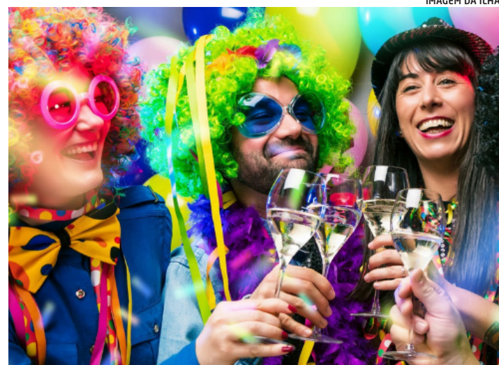
IMAGEM DA ILHA

O Carnaval é uma festa cheia de energia e alegria. Tempo de extravasar! Para muitas pessoas, isso significa participar de blocos de rua, curtir uma praia com amigos ou mesmo fazer aquele churrasco com a família.