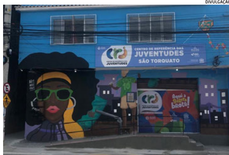
CRJ de São Torquato está em funcionamento há cerca de um ano

jovens gravando músicas, tendo esse contato mais profissional, acesso a um produtor à disposição para atender a juventude. Vai ser uma grande oportunidade pra essa galera”, finaliza.