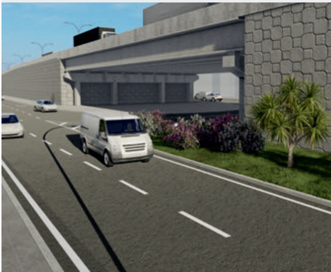
Retorno para Campo Grande