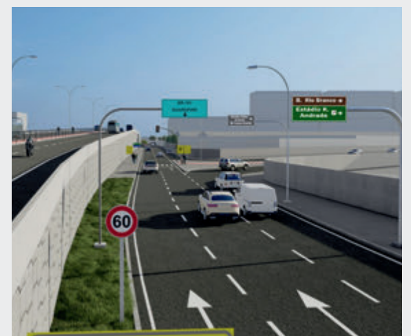
Pista lateral, acessos retorno