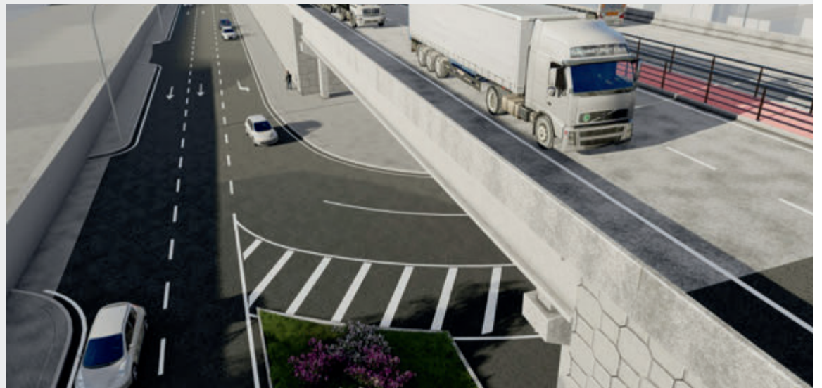
Retorno para Campo Grande