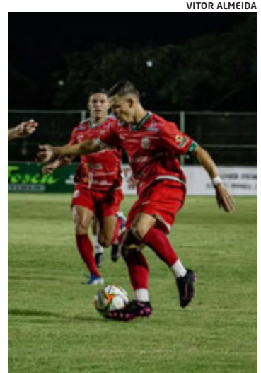
Jaguaré é o atual campeão da Série B e ainda está invicto