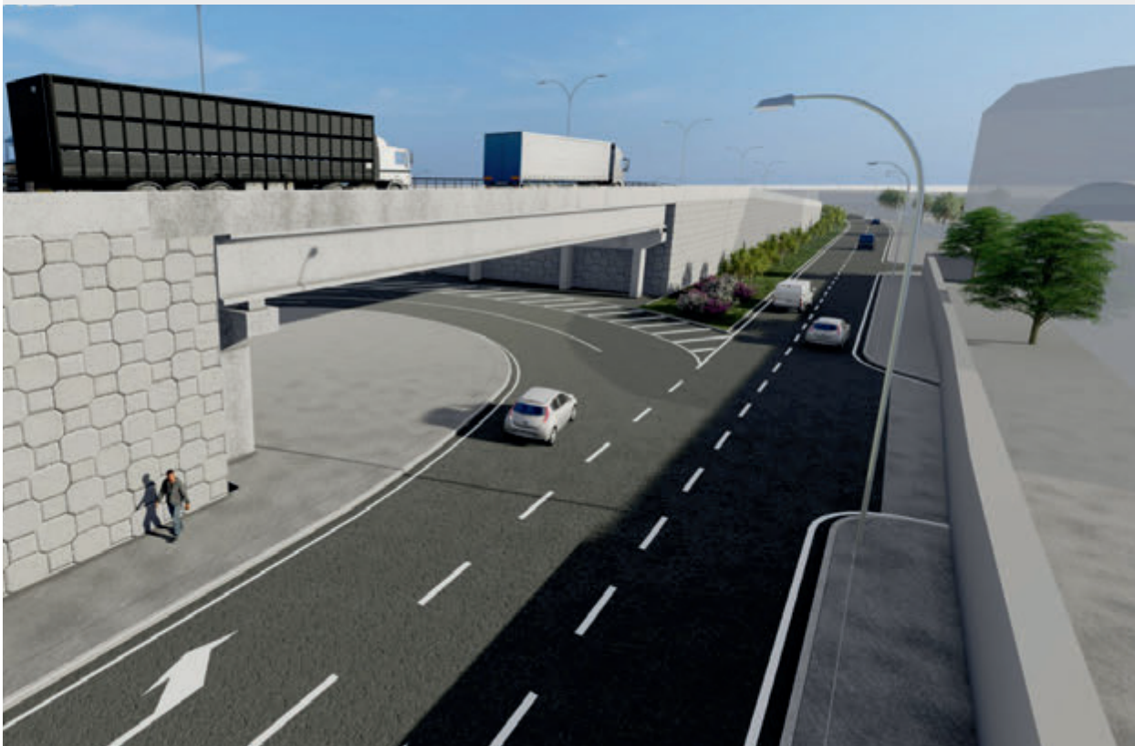
Retorno para Campo Grande