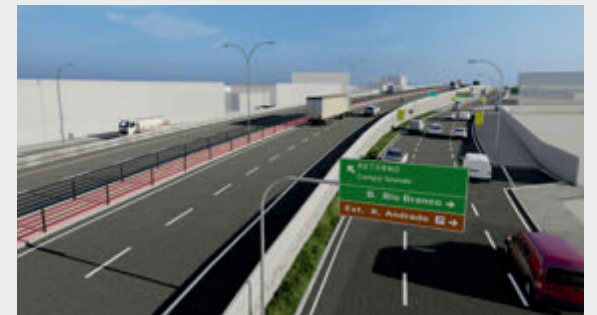
Pista lateral, acessos retorno