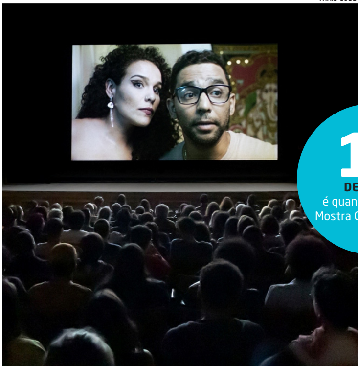
Mostra apresentará produções que marcaram história no festival

MAIOR EVENTO de cinema e audiovisual do Espírito Santo, o Festival de Cinema de Vitória completa 30 anos em 2023.