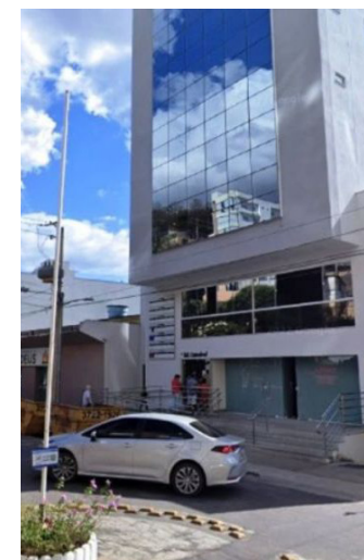
Escritório do Sebrae Colatina

Segundo o diretor, esse é um trabalho exclusivo, que oferece soluções específicas com especialistas do mercado e que inclui o acompanhamento mensal de indicadores, entre outros serviços. São vagas limitadas, e as inscrições já estão abertas pelo site https://cliente.sebraees.com.br/acceleracao-negocios .