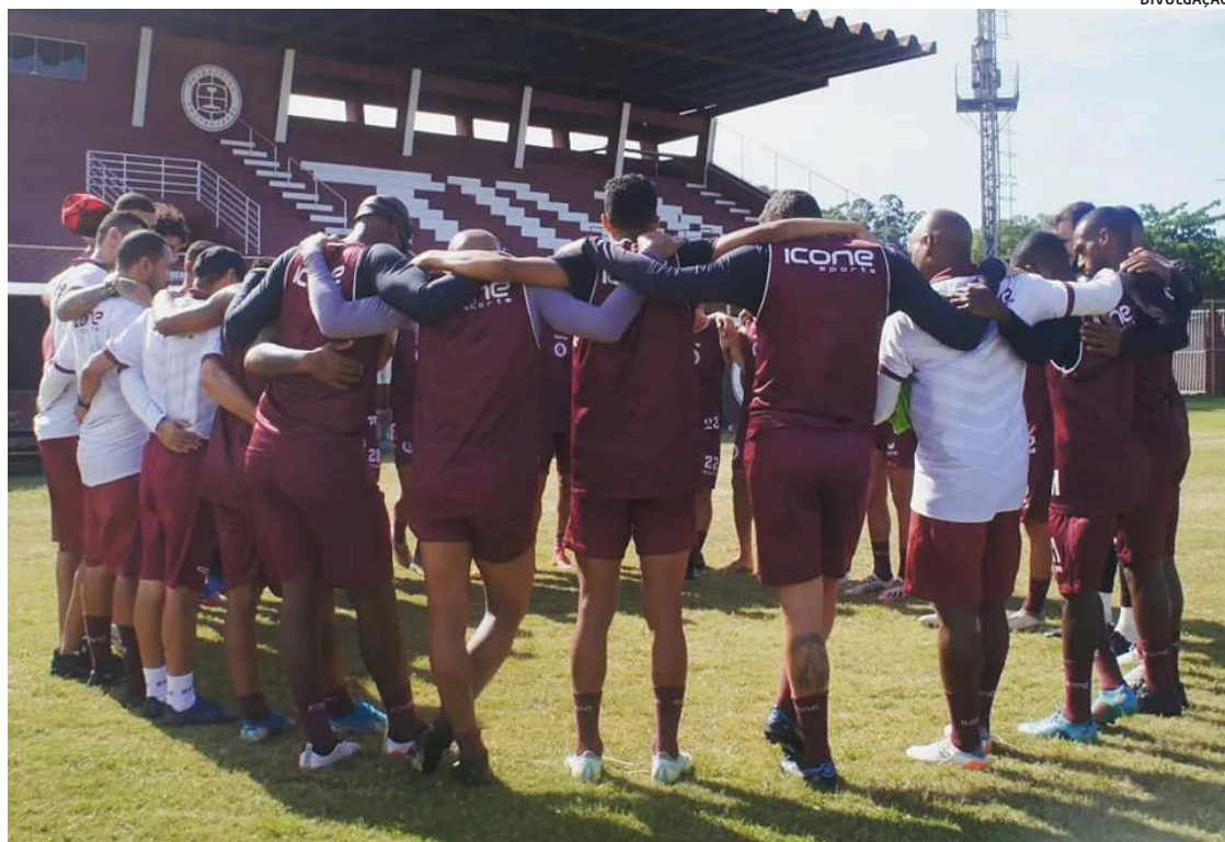
Desportiva precisa vencer e contar com tropeço do Estrela para não ser rebaixada para a Série B