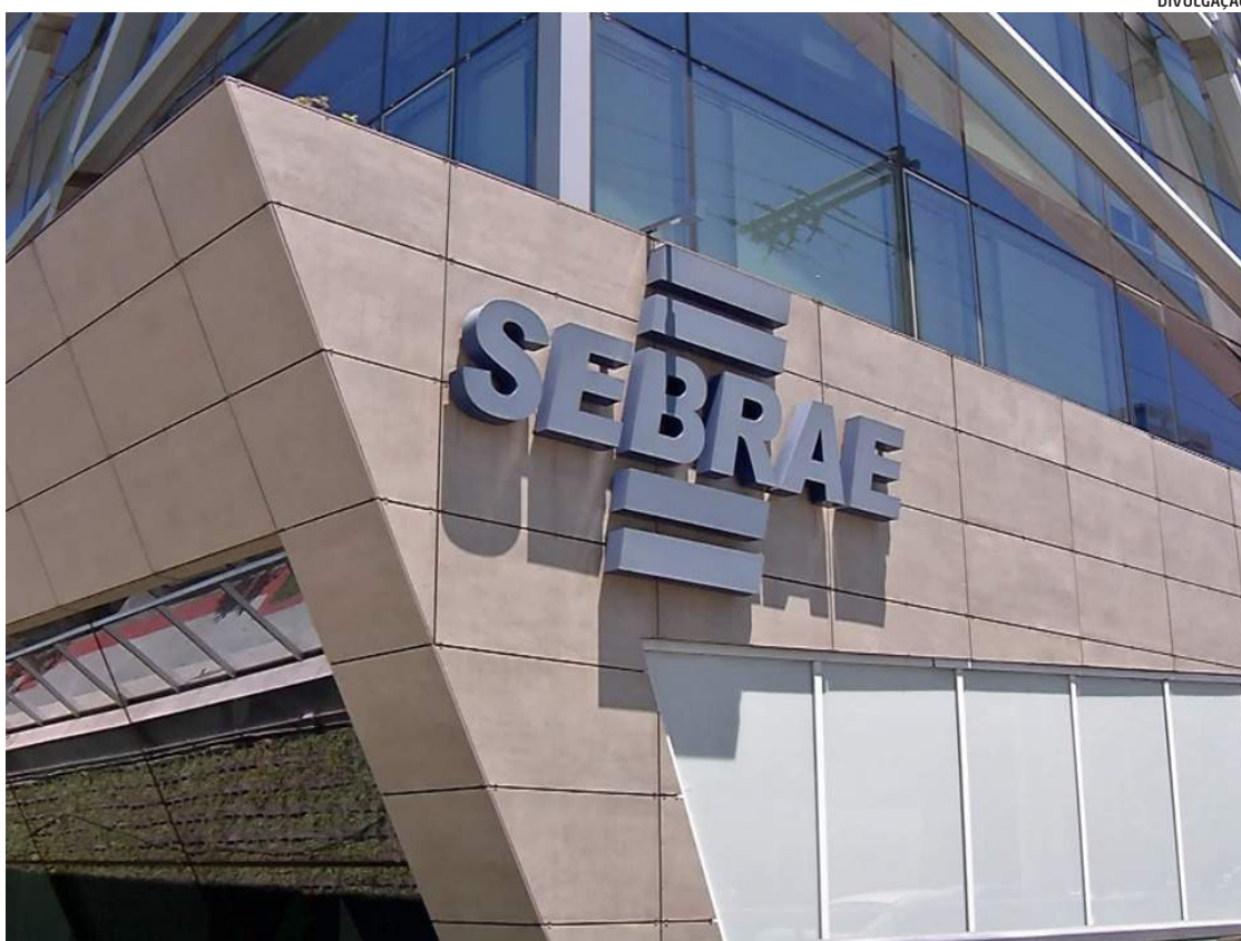
Sebrae tem uma equipe responsável por analisar os casos dos empresários que precisam de apoio

"Quando eu desci não tinha muito o que fazer, a água já estava na minha cintura, já havia entrado no carro, e em menos de meia hora, que foi o tempo que a gente teve para tentar salvar alguma coisa, a água já estava no meu pescoço. Foram momentos desesperadores, eu perdi 98% de todo o meu acervo de decoração que era de painéis de madeira, pinus, louças, móveis, arranjos de flores, perdi meu carro. Não