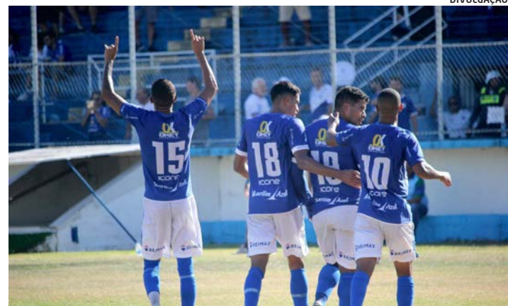
Vitória faz ótima campanha no Capixabão, dividindo liderança

Vem aí a Série D, e o Vitória, juntamente com o Real Noroeste, serão os representantes do Espírito Santo nesta competição.