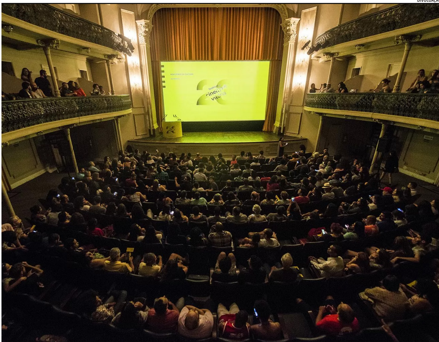
Realizadores de todo o Brasil podem enviar filmes produzidos entre os anos de 2022 e 2023 para a mostra competitiva do festival

Os filmes escolhidos pela curadoria do festival serão distribuídos em 11 janelas de exibição. Entre elas, estão a 27ª Mostra Competitiva Nacional de Curtas, com uma seleção de títulos da safra recente do cinema brasileiro; a 13ª Mostra Competitiva Nacional de Longas, que apresenta um panorama do cinema autoral nacional de longa-metragem; a 13ª Mostra Quatro Estações, com produções que abordam a temática da diversidade sexual; a 12ª Mostra Corsária, com filmes que apresentam pesquisas de linguagem da estética cinematográfica; a 12ª Mostra Foco Capixaba, janela exclusiva para realizadores do Espírito Santo; e a 10ª Mostra Outros Olhares, que propõe a obser-