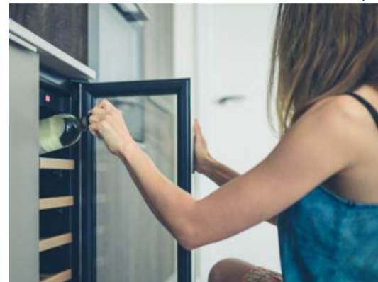
Após tirar o máximo de oxigênio da garrafa, o vinho dura no máximo três dias na geladeira

Abriu uma garrafa de vinho e não sabe como armazenar aquele restinho que não conseguiu beber? Hoje vamos falar de alguns métodos simples e baratos que fazem seu vinho se manter bom para ser consumido por alguns dias.