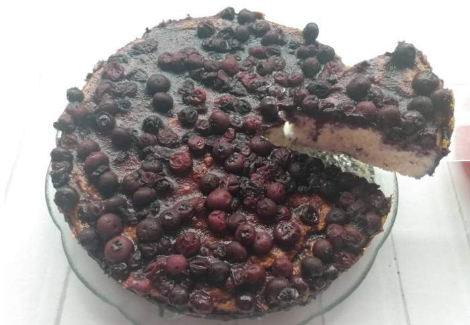
O Cheesecake de Mirtilo leva queijo ricota, deixando a sobremesa mais light e com sabor mais suave