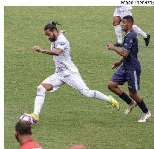
Rio Branco foi derrotado pelo Aster nos dois jogos das quartas de final da Copa Espírito Santo

A história dessas duas agremiações do Espírito Santo se iguala a tantas outras dos grandes clubes do futebol brasileiro. É de se lamentar que numa competição em disputa por vagas para disputas nacionais se comportem de maneira tão medíocre, deixando que outros clubes de menor porte e história venham passar à frente dessas duas potências do futebol capixaba.