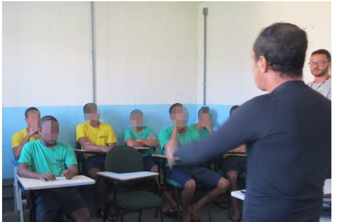
Dentre os adolescentes que realizam EJA a distorção idade-série é a maior: 4,2 anos em média